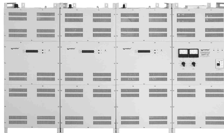
Рис. 1. Стабилизатор напряжения

Блоки стабилизатора состоят из 3-х отсеков. Для крепления к стене каждый блок имеет специальные петли в верхней части. Для крепления к полу используются отверстия в ножках блоков.