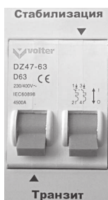
Рис.7. Отключены оба режима.

При неисправностях стабилизатора необходимо обращаться в сервисный центр, так как стабилизатор не рассчитан на самостоятельный ремонт пользователем.