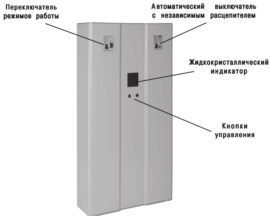
Рис. 1. Стабилизатор напряжения Etalon-S (м)

В верхней части расположен клеммник, для подключения стабилизатора, закрытый крышкой. Там же расположен заземляющий контакт.