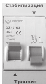
Рис.8. Режим «Транзит»