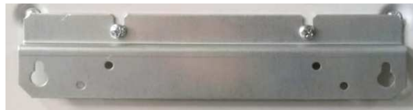
Рис. 2 Крепежная планка

Для размещения стабилизатора на стене сначала монтируется крепежная планка (рис.2), потом на нее подвешивается аппарат и производится подключение токоведущих проводников. Упорная планка на стабилизатор установлена с завода (рис.3).