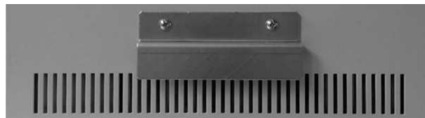
Рис. 3 Упорная планка