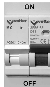
Рис.6. Автоматический выключатель