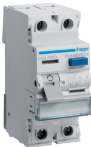
ПЗВ 2Р 63А 500мА А