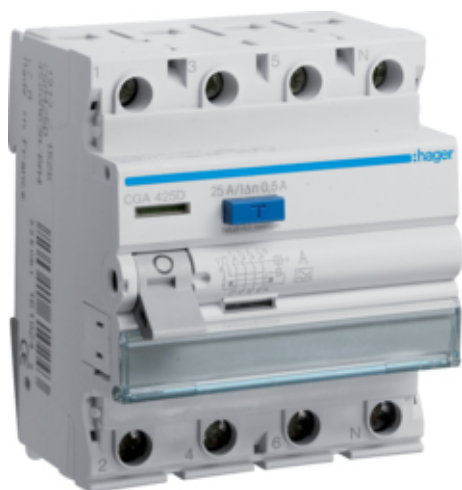
ПЗВ 4P 25A 500mA A