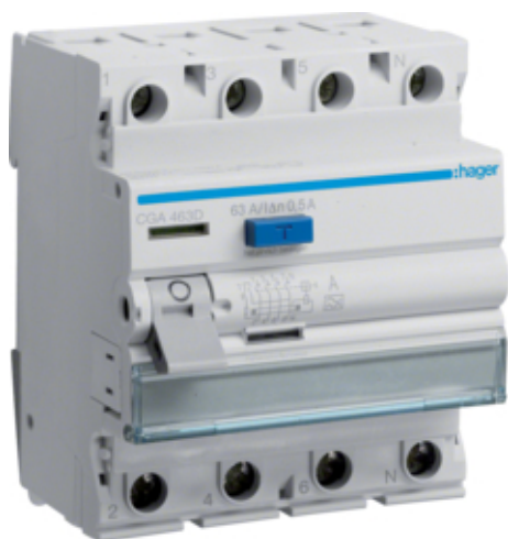
ПЗВ 4Р 63А 500mA А