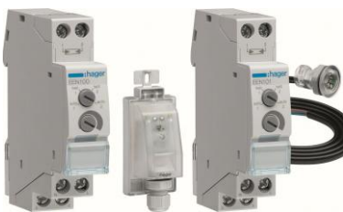
EEN100, EEN101 EEN003, EEN002